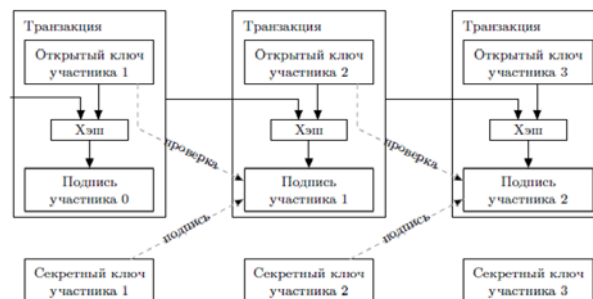
Рисунок 1. Схема подтверждения правоты совершения транзакции

Каждый участник сети при регистрации в сети и установке необходимого программного обеспечения на рабочую станцию получает набор из двух криптографических ключей: закрытого – для шифрования транзакции, и открытого – для верификации транзакции.