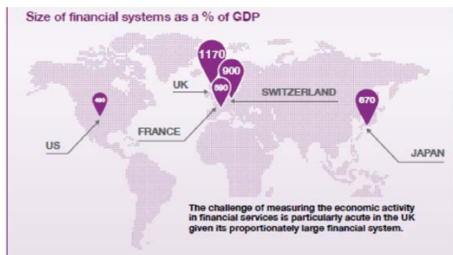
Рис. 1. Размер финансовых систем разных стран в % к ВВП ([1])

Видно, что у Великобритании его размер [1], например, в более чем в 11 раз больше ВВП страны и должен быть предметом особой заботы государства.