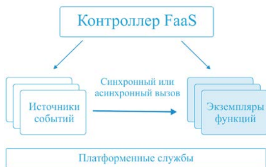
Рис. 3. Ключевые элементы решения Function-as-a-Service.

На рис. 3 показаны ключевые элементы решения FaaS: